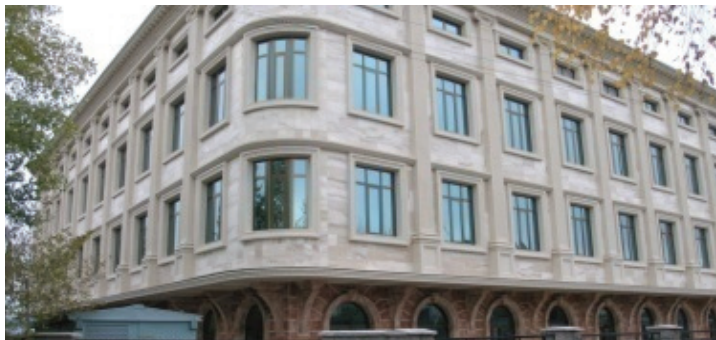
Общий вид здания