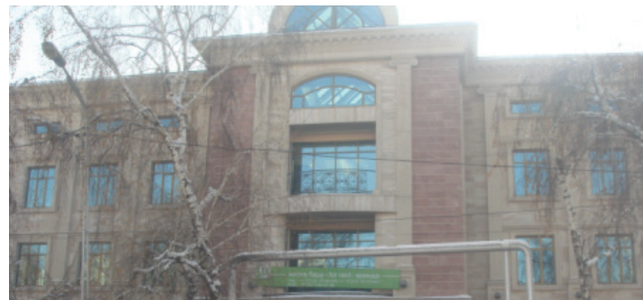
Общий вид здания