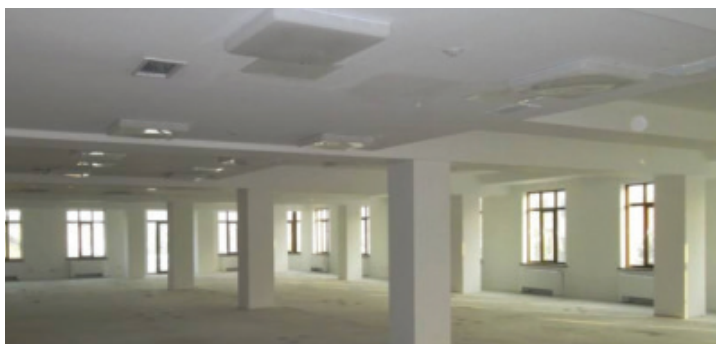
Текущее состояние офисов