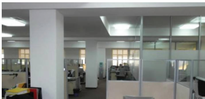
Действующий офис на 3 этаже